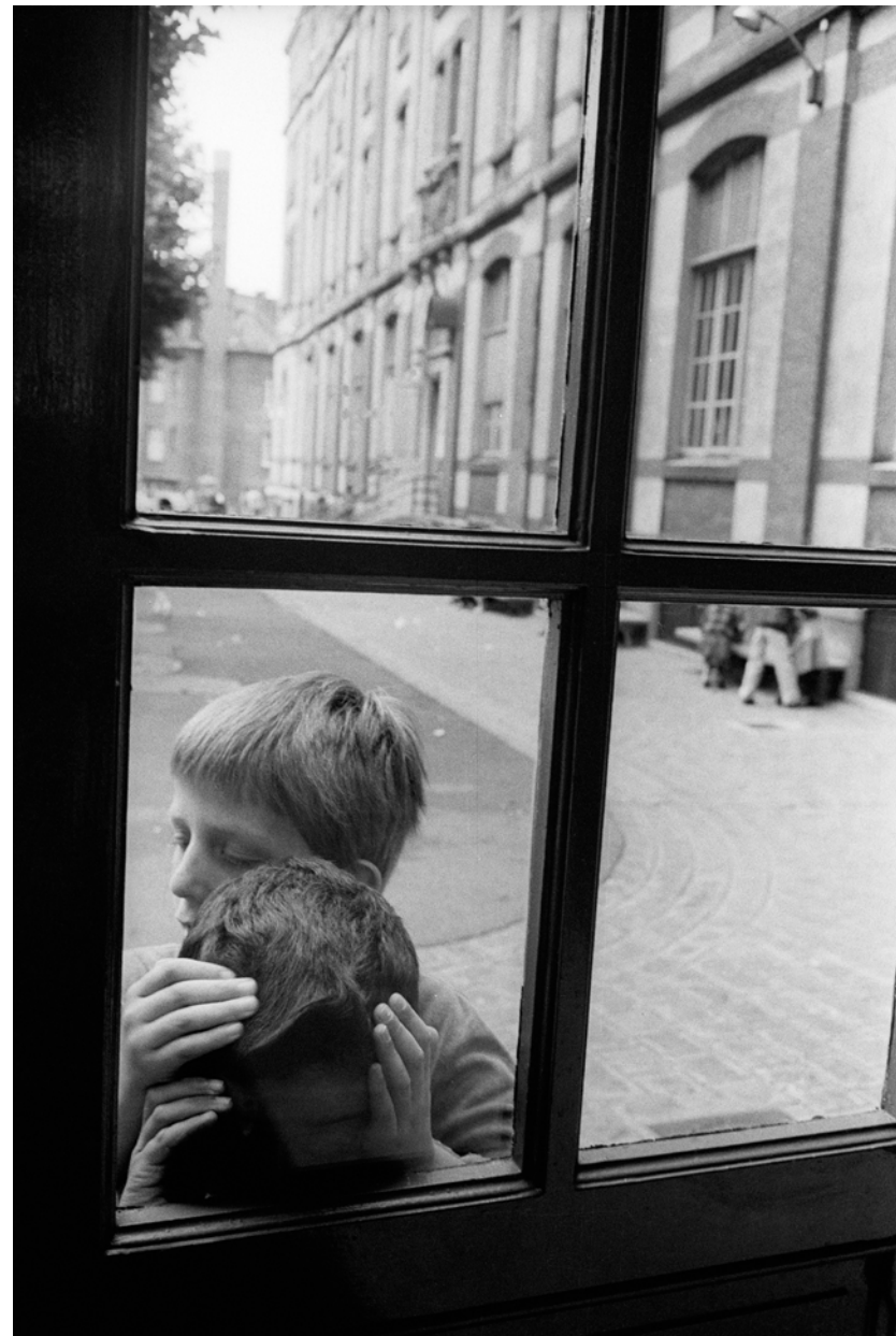
France, Saint-Mandé, L'Institut Départemental des Aveugles., Extérieur nuit , - 1980