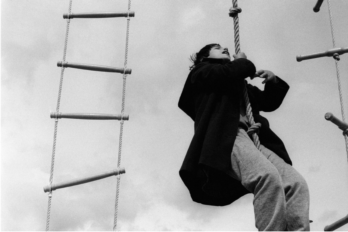
France, Ambares et Lagrave, Centre de Soins et d'Éducation Spécialisée Alfred Peyrelongue, Extérieur nuit , - 1985