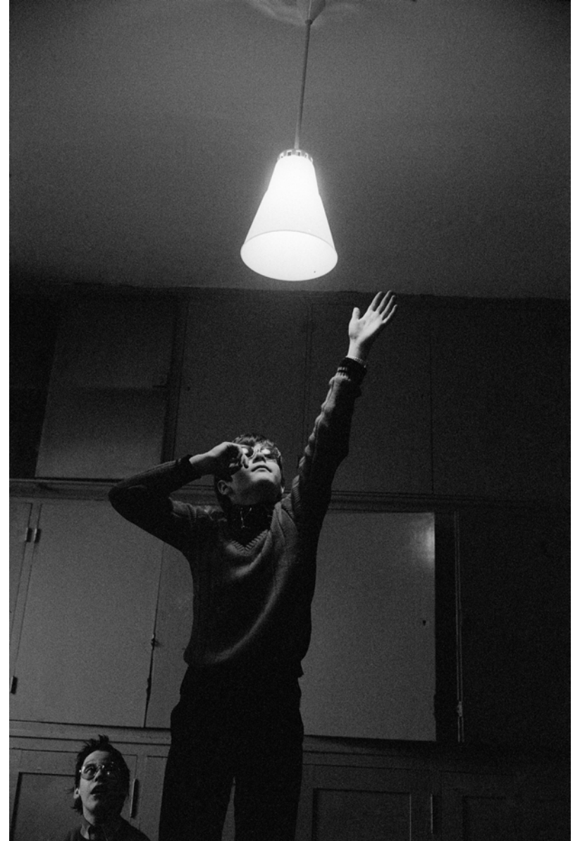
France, Paris, L'Institut National des Jeunes Aveugles, Extérieur nuit , - 1979