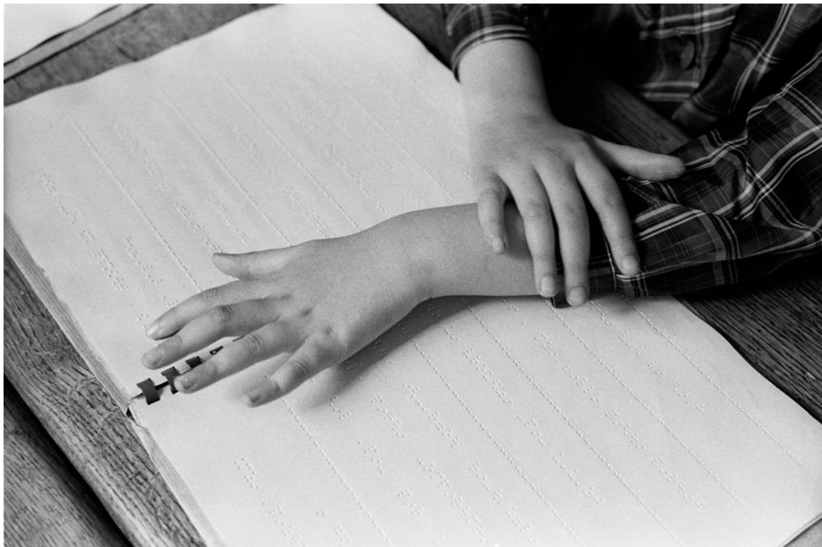
France, Saint-Mandé, L'Institut Départemental des Aveugles., Extérieur nuit , - 1980