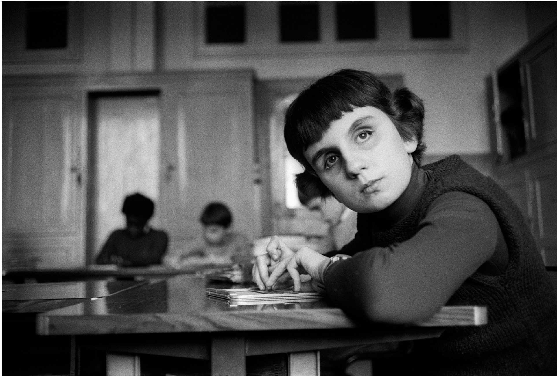
France, Paris, L'Institut National des Jeunes Aveugles., Extérieur nuit, - 1979