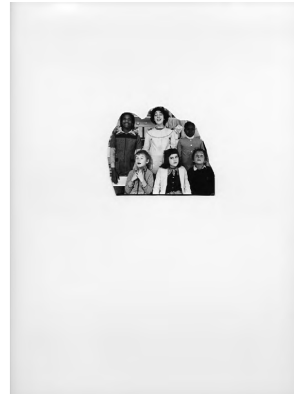
France, Saint-Mandé, Institut Départemental des Aveugles, Extérieur nuit , Tirage d'époque , Noir et Blanc,