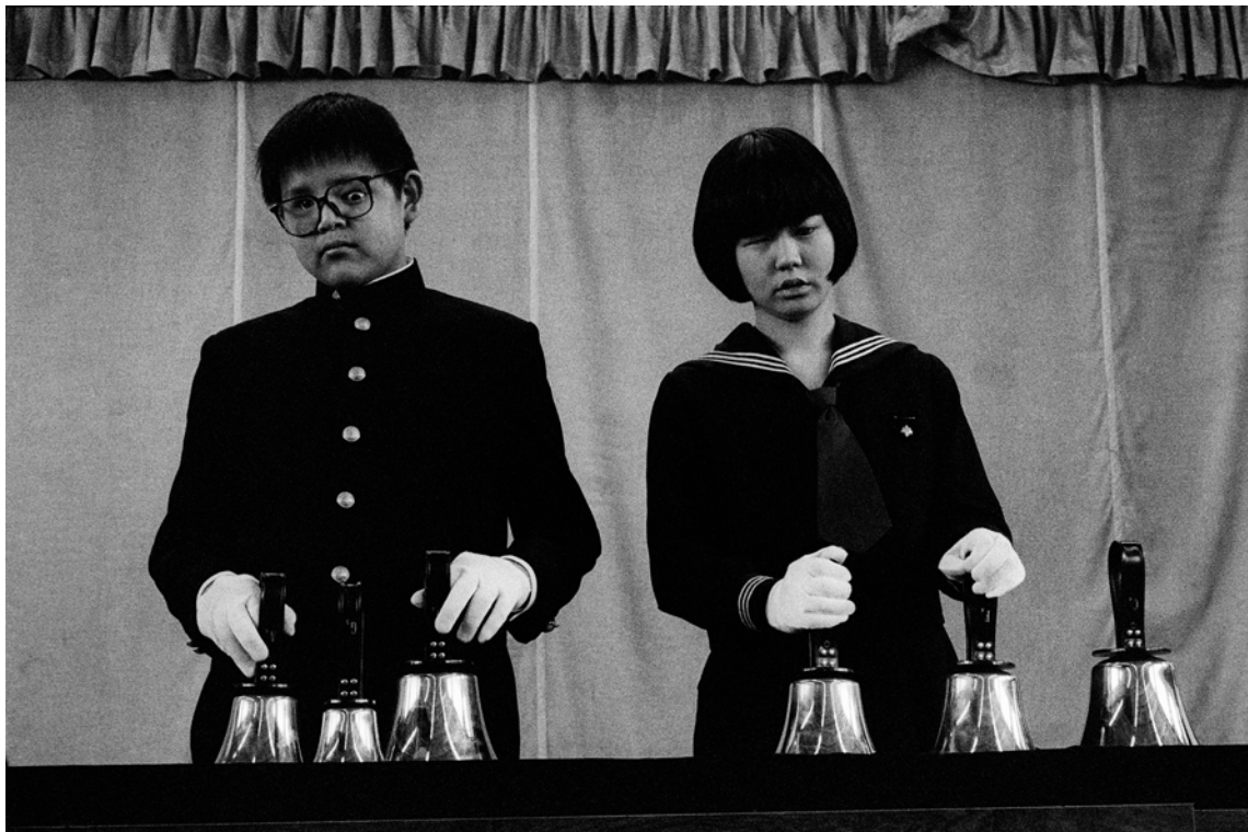
Japon, Tokyo, Université pour les Aveugles de Tsukuba., Extérieur nuit, - 1989