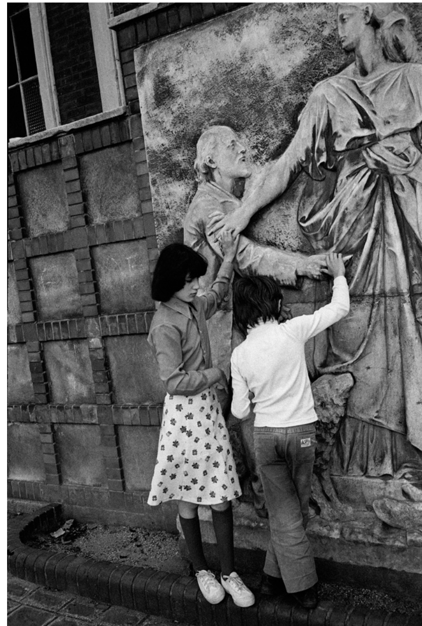
France, Saint-Mandé, L'Institut Départemental des Aveugles., Extérieur nuit, -