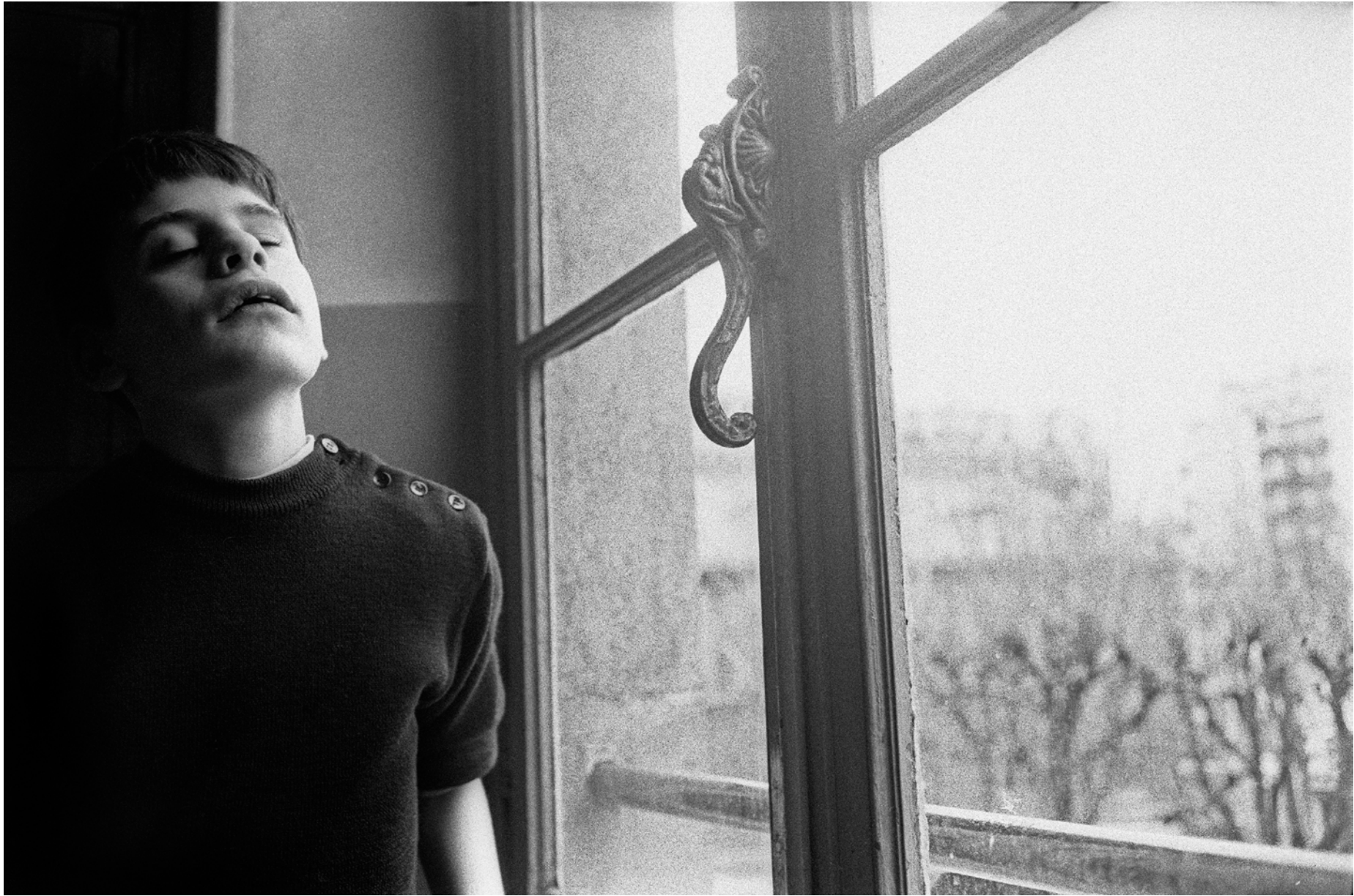
France, Paris, L'Institut National des Jeunes Aveugles., Extérieur nuit , - 1979