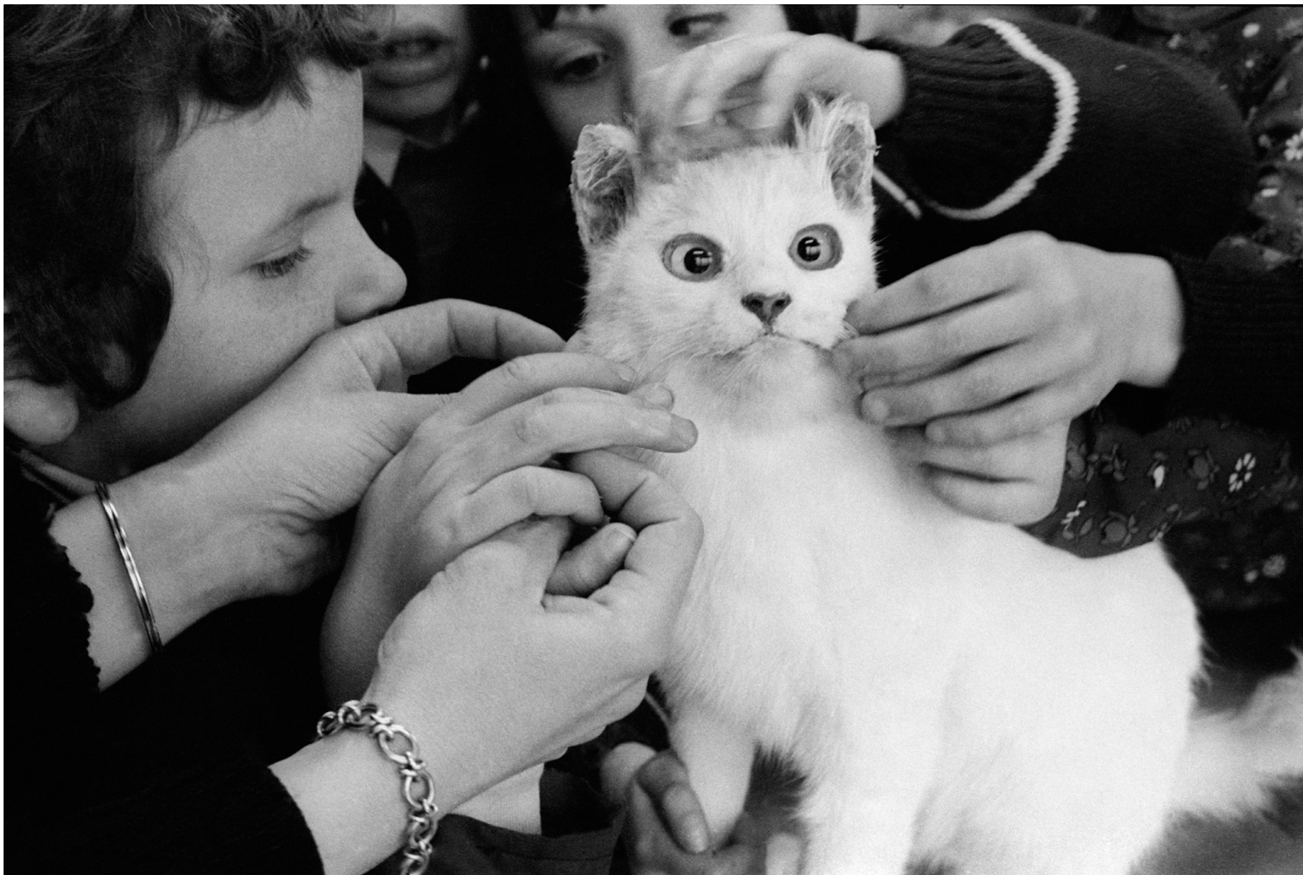
France, Vertou, Institut Départemental des Aveugles et des Malvoyants, Les Hauts-Thébaudières, Extérieur nuit ,