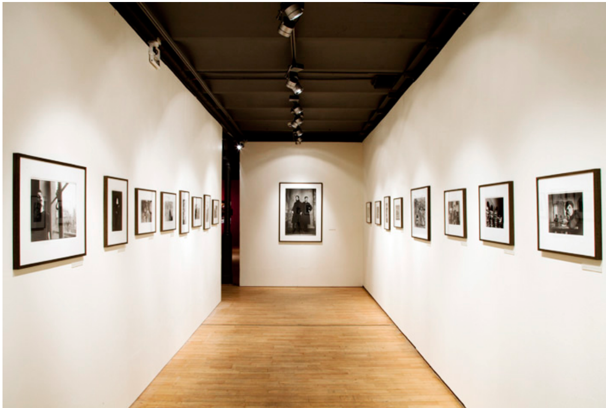
Rétrospective Jane Evelyn Atwood - Photographies 1976-2010, La Maison Européenne de la Photographie, Paris,