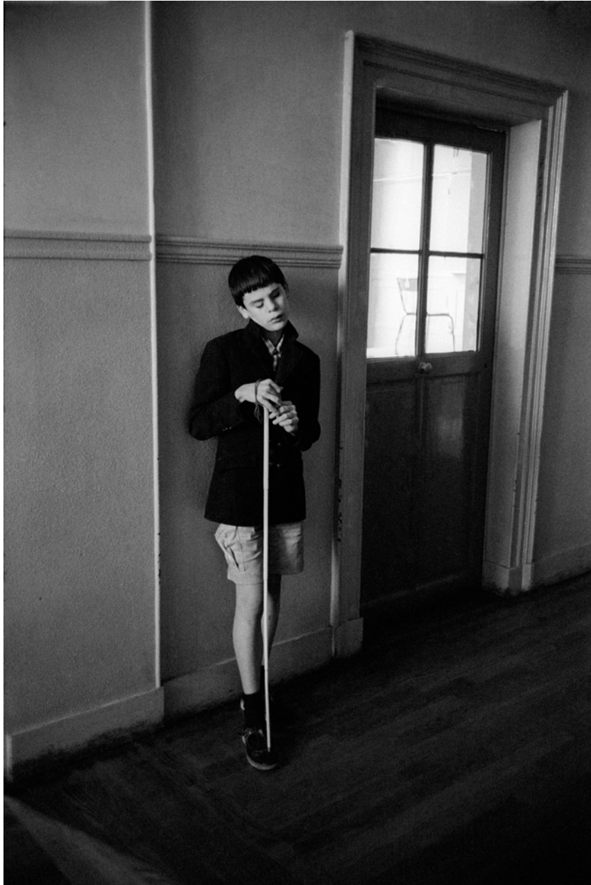
France, Paris, L'Institut National des Jeunes Aveugles., Extérieur nuit , - 1979