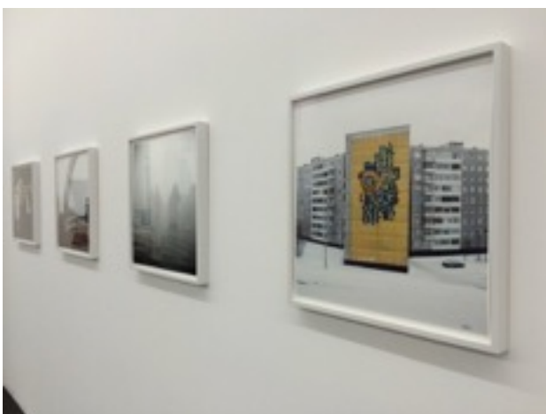
Exposition Dusha + Icons , L'Oiseau, Paris, 2015