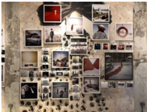
Exposition Vento Dall' Est , Nonostante Marras, Milan, 2018