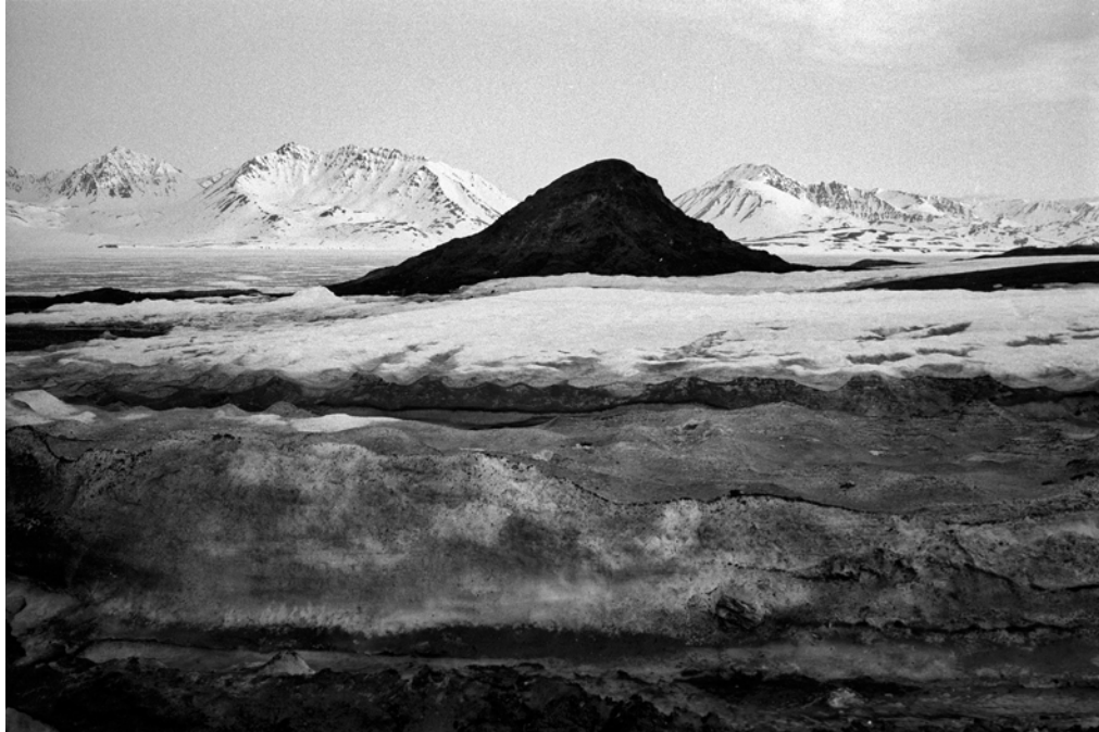
Russie, Détroit de Bering, Peuples de Sibérie - 1999