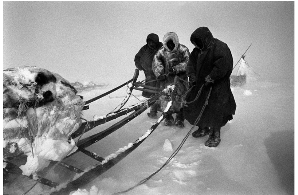
Russie, Presqu'île du Yamal, Peuples de Sibérie - Avril 1998