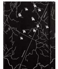
Amour , Chose Commune, 2019