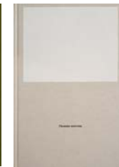
L'Homme nouveau , Filigranes Éditions, 2017