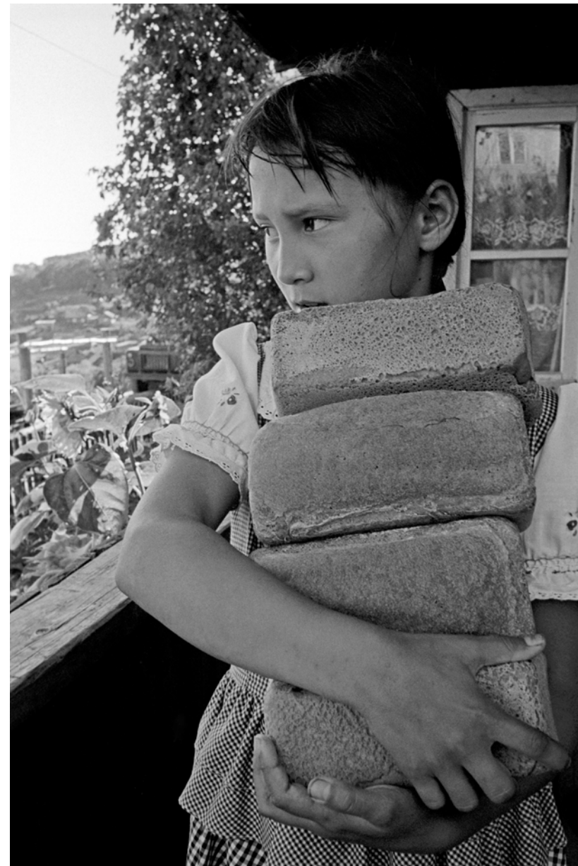
Russie, Nergen, Peuples de Sibérie - Aout 1997