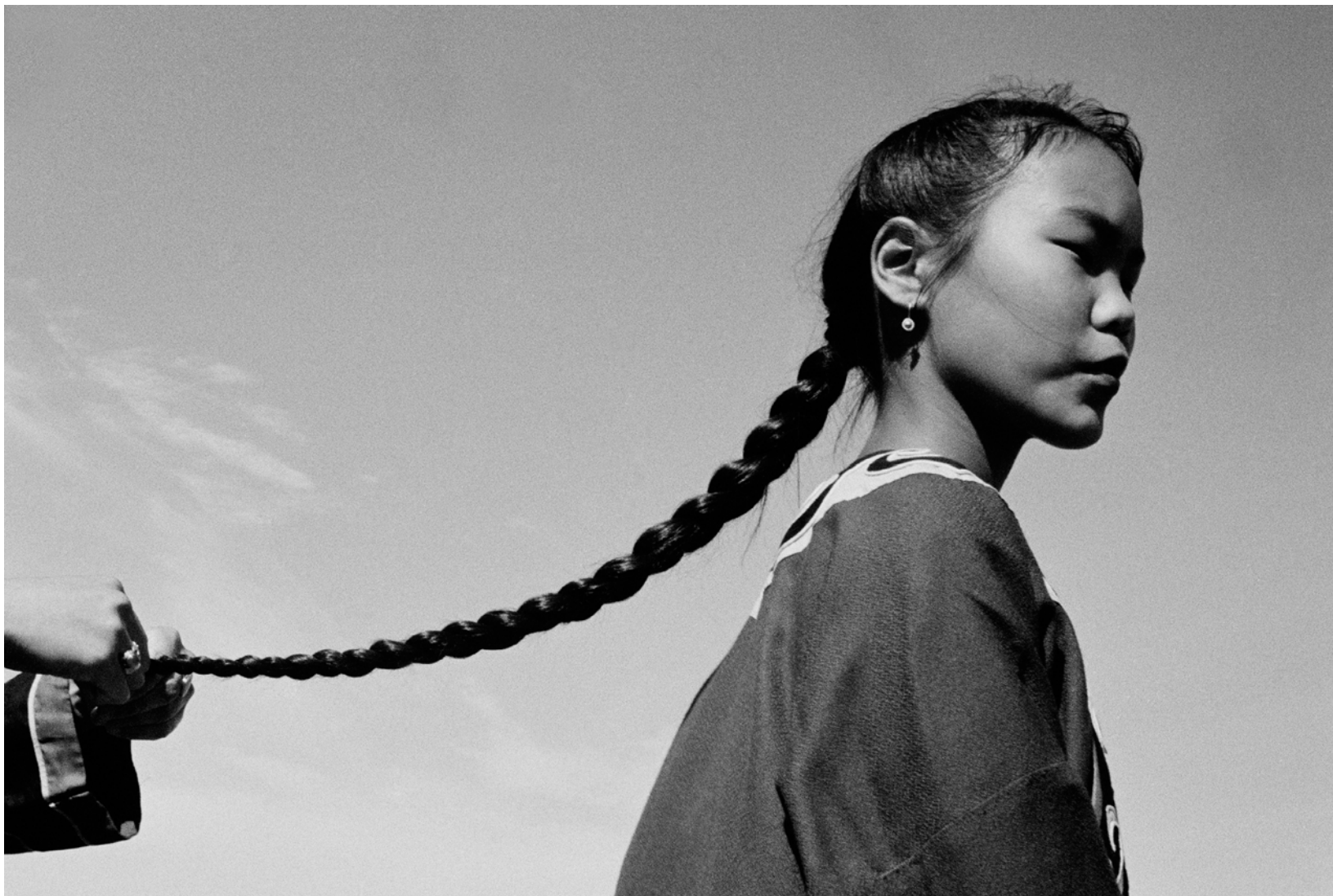
Russie, Boulava, Peuples de Sibérie - Septembre 1997