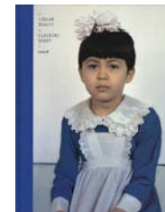
Loulan beauty , Éditions du Chêne, 2007