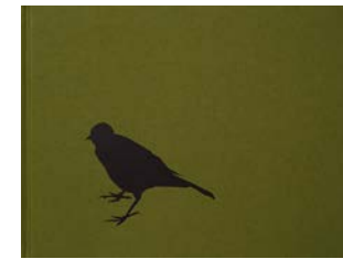
Sasha , Éditions du Caillou bleu, 2011