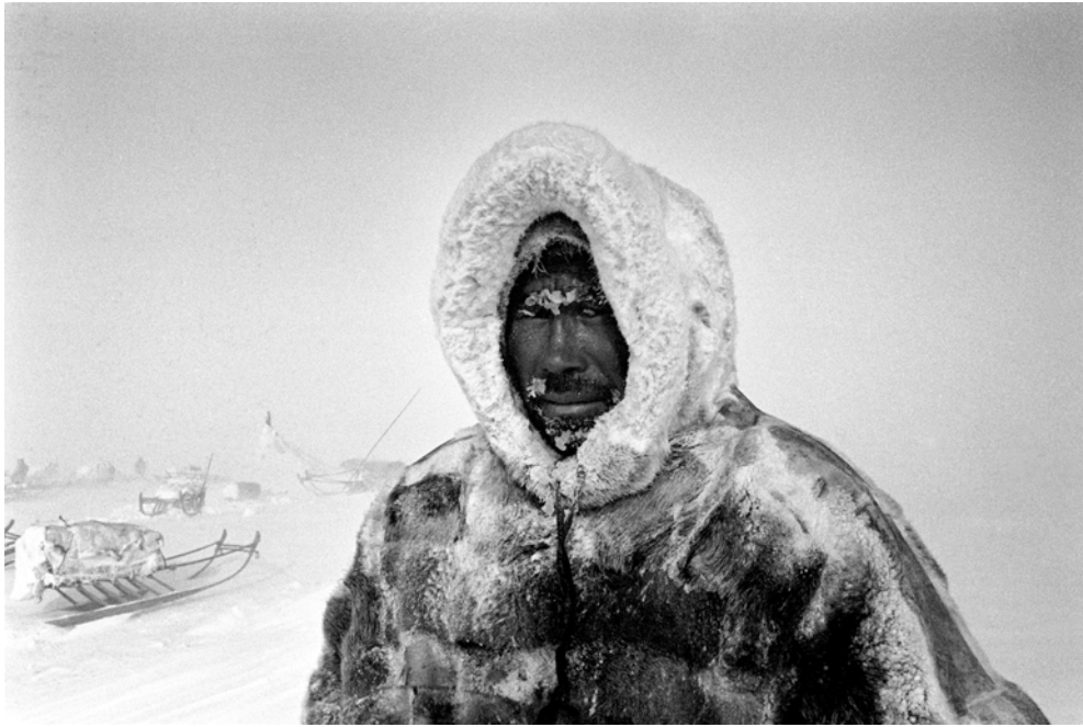
Russie, Presqu'île du Yamal, Peuples de Sibérie - Avril 1998