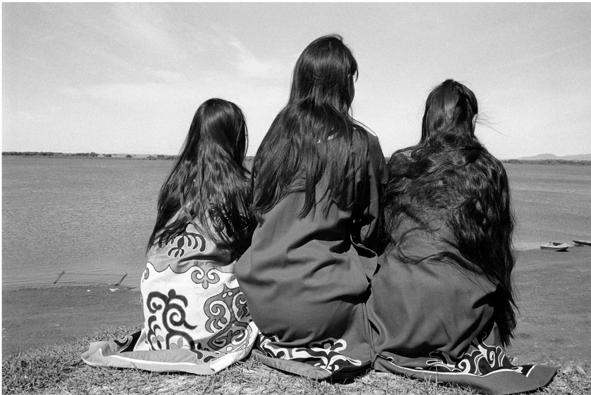
Russie, Boulava, Peuples de Sibérie