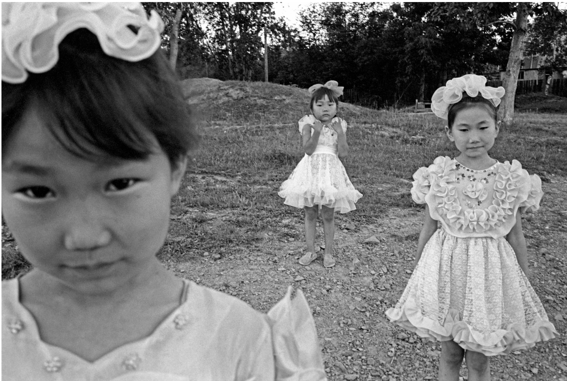
Russie, Nergén, Peuples de Sibérie - Aout 1997