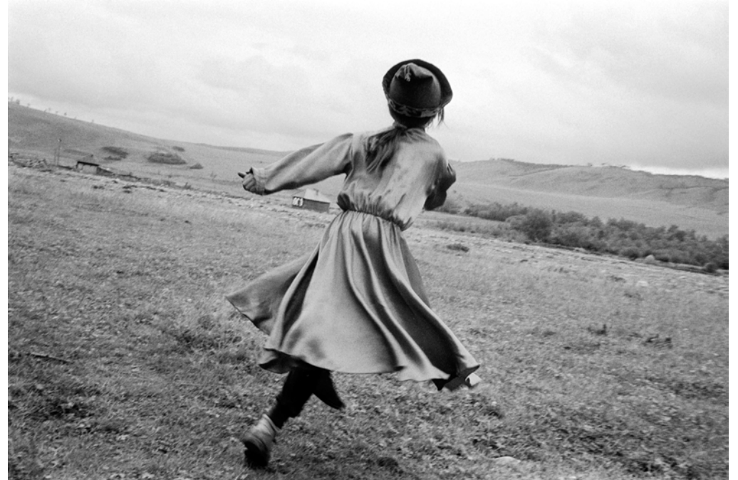
Russie, Tonta, Peuples de Sibérie - Aout 1998