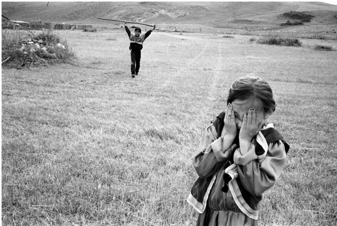
Russie, Tonta, près du lac Baïkal, Peuples de Sibérie - Aout 1998