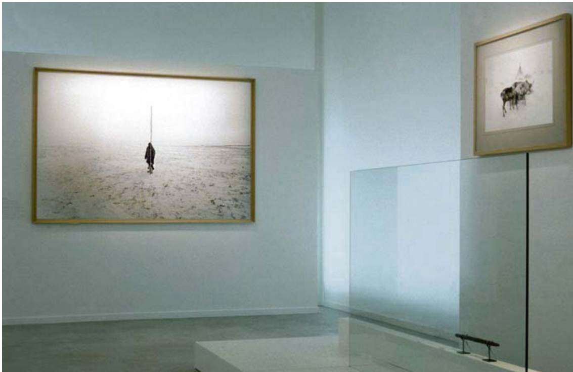
Peuples de Sibérie , Parc de la Villette, Pavillon Paul Delouvrier, Paris, 1999